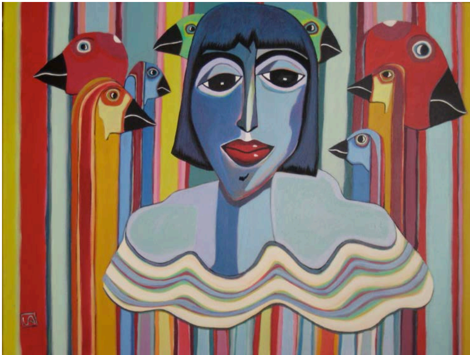
Pilar el lunes por la mañana en el zoo